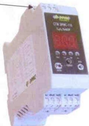
Рис. 2 Система газоаналитическая многофункциональная СГМ ЭРИС-110 (DIN-рейка)