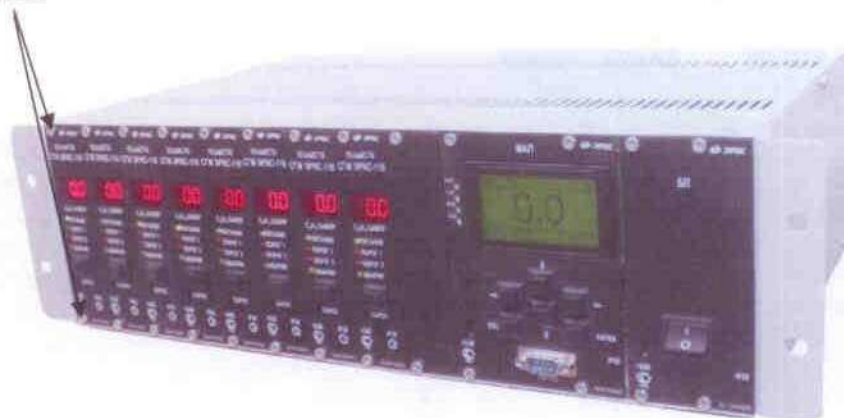
Рис. 1 Система газоаналитическая многофункциональная СГМ ЭРИС-110 (19" слот)