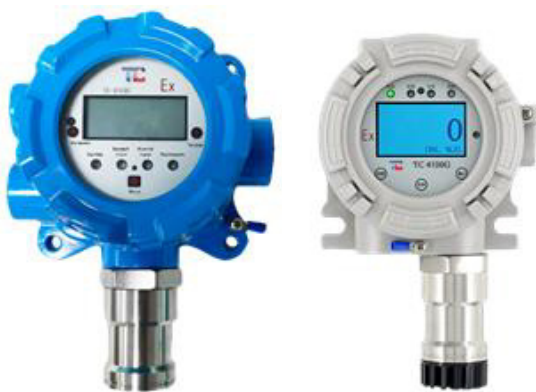
л) модификация ТОП-СЕНС 4100 G