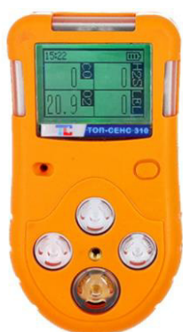
в) модификация ТОП-СЕНС 310