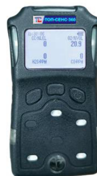
г) модификация ТОП-СЕНС 360