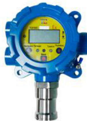
м) модификации ТОП-СЕНС 4100 S